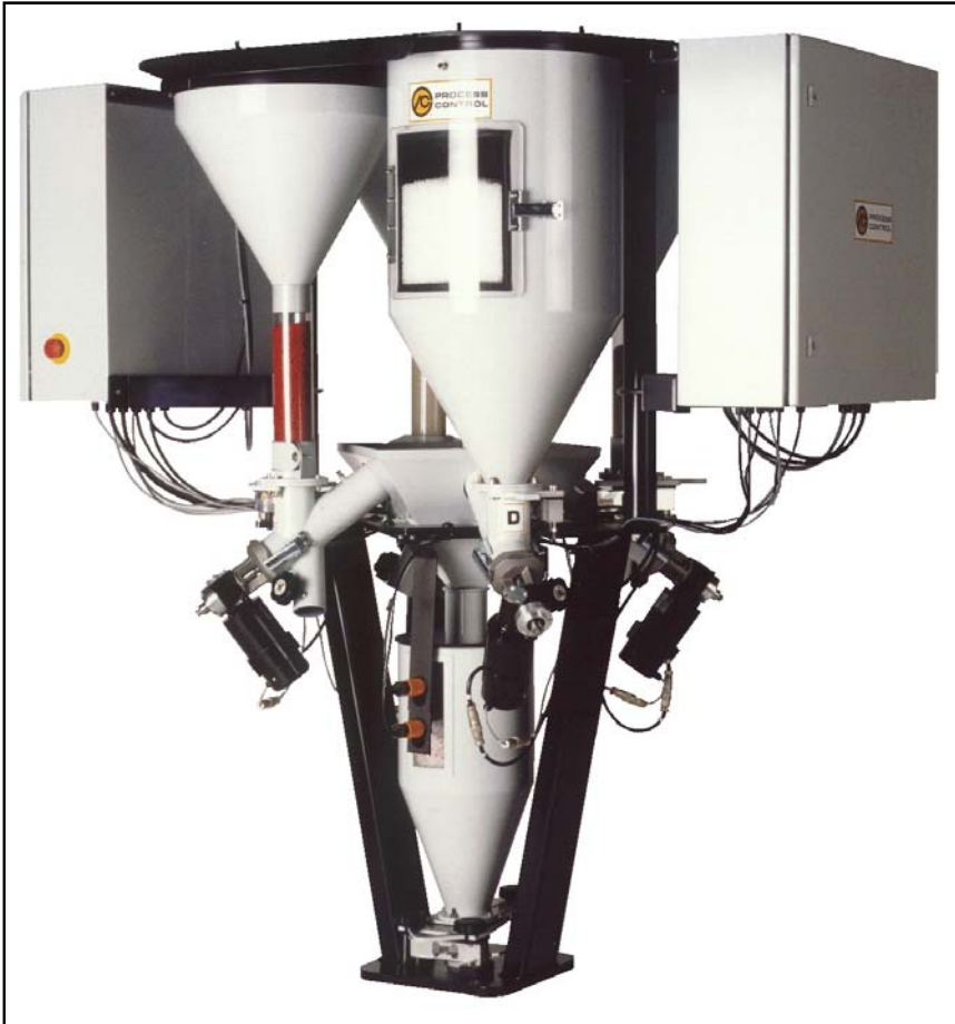
La serie X: Trasformatevi nella produzione di miscele omogenee peso-esatte. L'immagine mostra un attrezzo del tipo XGG4.

I miscelatori gravimetrici continui della Serie X offrono un'accuratezza ed un'omogeneità di miscelazione ineguagliabile per un gran numero di configurazioni rispondendo così a molteplici necessità applicative. Per applicazioni dove il montaggio è previsto alla bocca dell'estrusore, i miscelatori della Serie X vengono equipaggiati con un sistema integrato di convogliamento allo scopo di evitare demiscelazioni dei materiali. Per montaggi off-line o su mezzanino questo